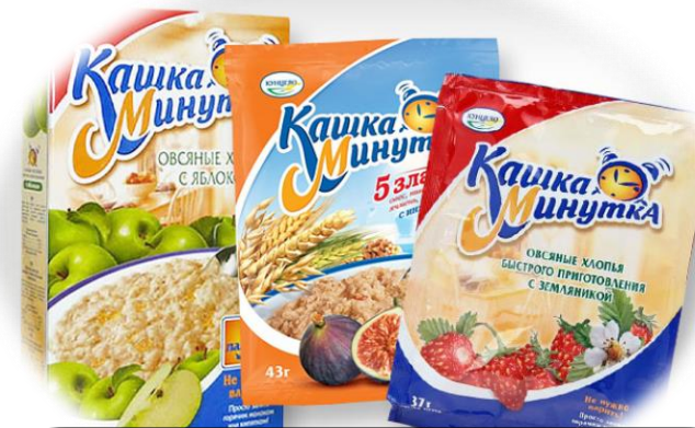
Сашеты в коробке