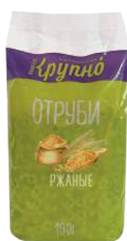
Отруби ржаные Вес: 160 г. Срок годности: 10 мес.