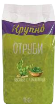
Отруби овсяные с ламинарией Вес: 160 г. Срок годности: 10 мес.