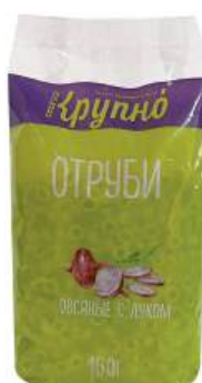
Отруби овсяные с луком Вес: 160 г. Срок годности: 10 мес.