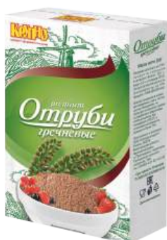
Отруби гречневые пищевые Вес 200 г. Срок годности: 12 мес.