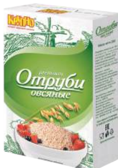
Отруби овсяные пищевые Вес 200 г. Срок годности: 12 мес.