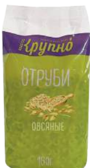
Отруби овсяные Вес: 160 г. Срок годности: 10 мес.