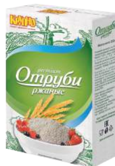
Отруби ржаные пищевые Вес 200 г. Срок годности: 12 мес.