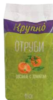
Отруби овсяные с томатом Вес: 160 г. Срок годности: 10 мес.